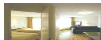
Del i Svit i Pärnu Dubbel insideshytt båt