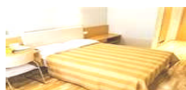
Pärnu Enkelrum Pärnu Enkel insideshytt båt